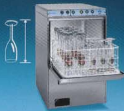
48 x 54 x H 73,5 cm APS 48 B 48 x 54 x H 69 cm