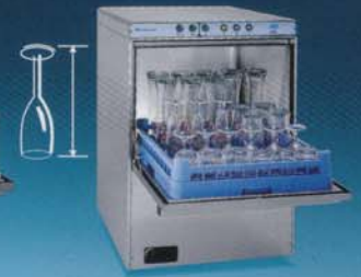
60 x 60,5 x H 81 cm