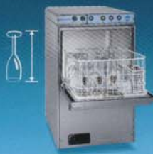
43 x 49 x H 69 cm