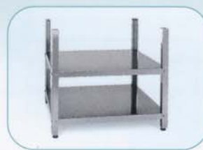
Unterbau offen 43|48|53|60