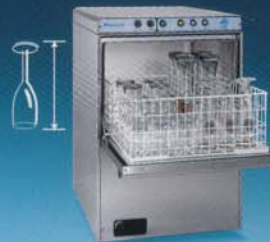
53 x 60 x H 75,5 cm