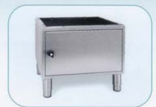
Unterbau mit Klappe |60